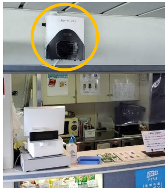
スーパージェット売店