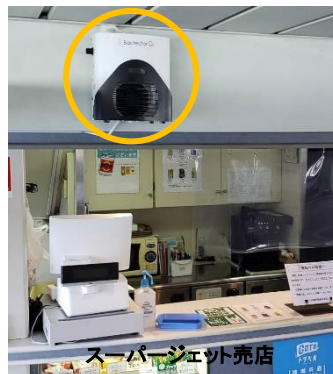
スーパージェット売店