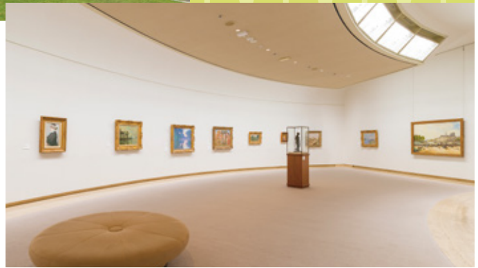
ひろしま美術館 本館展示室

●クルーズフェリーからスーパージェットへの変更は追加料金がかかります。 ●スーパージェットのスーパーシート(2階席)往復ご利用の場合は、事前購入に限り800円プラス。 ●小学生料金設定はございません。 ●車両の設定はございません。 ※写真はイメージです。